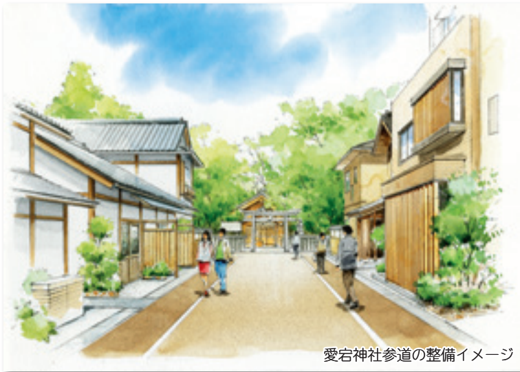
愛宕神社参道の整備イメージ