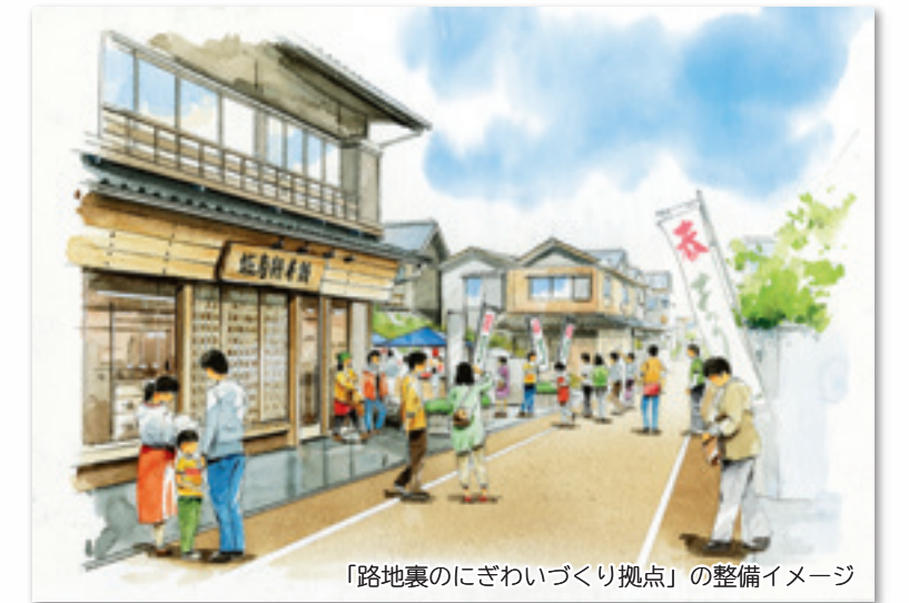
「路地裏のにぎわいづくり拠点」の整備イメージ