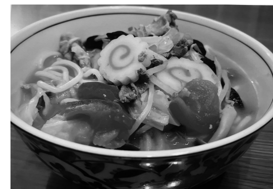
▲野菜たっぷりトマトちゃんぽん