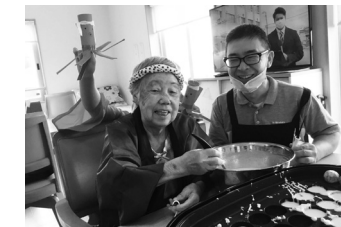
「たこ焼きはじめました」 (C) 山本 勉

なお、参加者の方には、展示された大判プリント写真を差し上げます。詳しくは、文化芸術課へ。