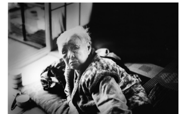
「おふくろさん」 (C) 横田 迪男