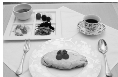
▲とまと記念館のオムライス