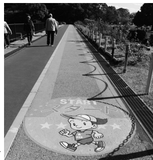
大池公園のペース体感ゾーン▶

運動応援メニューの星判定をチェックして有酸素運動を始めましょう。 ペース体感ゾーンのある公園で自分にあったペースを体感してみませんか。