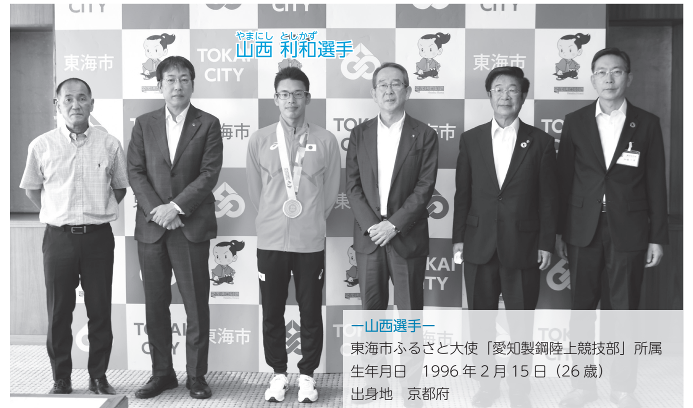
一山西選手一 東海市ふるさと大使「愛知製鋼陸上競技部」所属 生年月日 1996年2月15日(26歳) 出身地 京都府