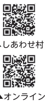
▲しあわせ村 ▲オンライン

しあわせ村で行う講習会に加えてオンライン講習会を行います。どちらか希望する方を選択してください(オンライン講習会はWebex Meetingsを使用・申込者には、テキスト、接続方法についての説明書を郵送)。