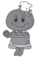
Copyright © 2011 東海商業高校. All rights reserved.

品と交換した方のうち、アンケートにご協力いただいた方は、ダブルチャンスに応募できます。