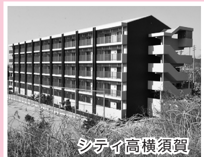
左：2億1,751万円 中：6億7,732万円 右：9億2,674万円