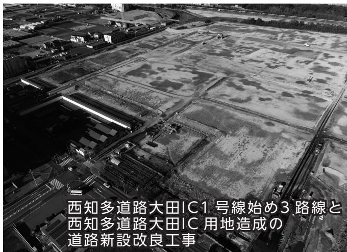
西知多道路大田IC1号線始め3路線と西知多道路大田IC用地造成の道路新設改良工事