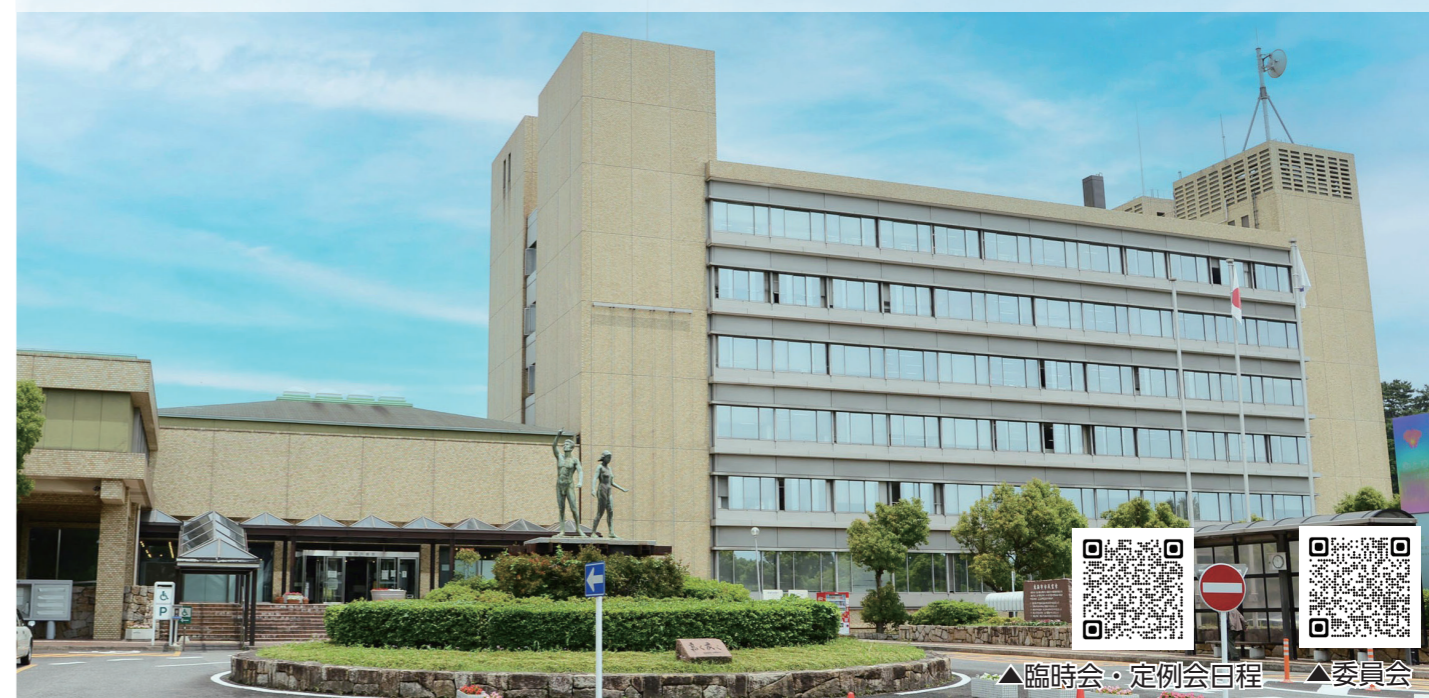
▲臨時会・定例会日程 ▲委員会