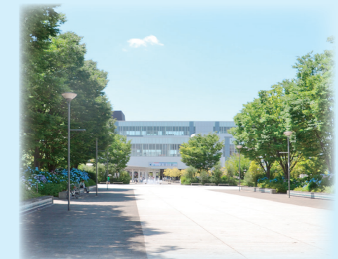
太田川駅東歩道 (50m歩道)