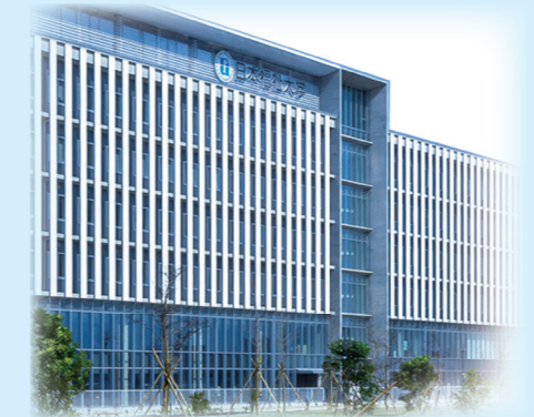
日本福祉大学東海キャンパス