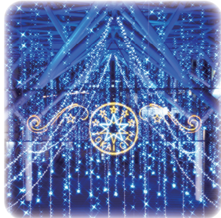
太田川駅西歩道 (ウィンターイルミネーション)