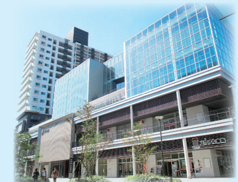
市街地再開発事業 芸術劇場(ユウナル東海)

高次都市機能地区 都市拠点の魅力向上及び都市全体の活力・にぎわいの向上に資するための高次都市機能拠点の形成を図る地区