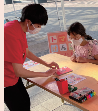
▲昨年のイベントの様子

トマフェスPRイベント 東海樟風高校の生徒と一緒に、短冊に願い事を書く七夕コーナーや、ミニゲームなどを楽しみませんか。 参加者には各種景品も用意! とき 7月6日(木) 16時～17時30分 ところ 太田川駅西側大屋根広場