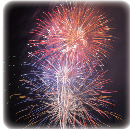
太田川駅西地区内 (令和3・4年サプライズ花火)