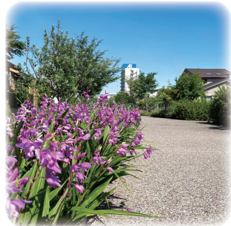
太田川駅東歩道 (ランの道)

現在、事業スタートから30年以上が経過し、5年度末に新たな節目を迎える「太田川駅周辺地区」と、西知多道路の大田IC(仮称)の整備を契機に進められている「太田川駅西地区」を合わせた約100haの中心市街地整備により、にぎわいの創出や交流人口の拡大を目指したまちづくりを進めています。