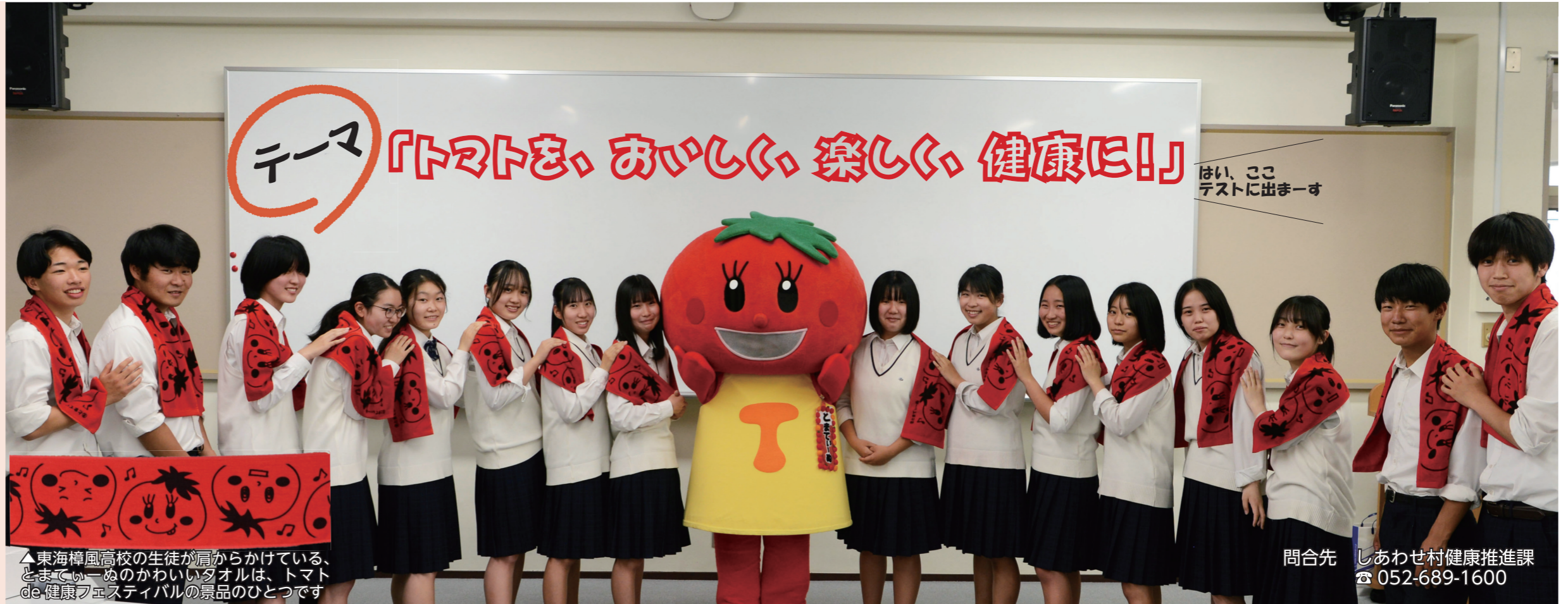
▲東海樟風高校の生徒が肩からかけている、とまていーぬのかわいいタオルは、トマト de 健康フェスティバルの景品のひとつです