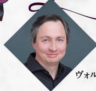
ヴァオルフラム・リーガー (ピアノ)