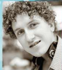
コスチャンチン・マイオロフ