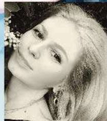
オクサーナ・ボンダレンコ