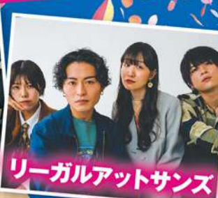
リーガルアットサンズ