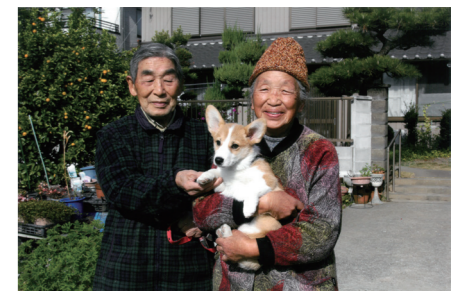
▲前回の出品作品 (c)大野宣隆「家庭円満」

対 知多半島5市5町在住・在勤・在学者(プロ・アマ・年齢不問) テーマ 人生を積み重ねた高齢者の奥深い表情や、生活を営む姿(被写体は80歳以上の方) 内 日本を代表する音楽写真家の故・木之下 晃さんが主導していた公募展 ¥ 1,000円 他 募集要項と規定用紙は、芸術劇場HPに掲載 申/問 10/31 (火) までに規定用紙、作品、参加料を芸術劇場文化芸術課へ ☎ 0562-38-7030