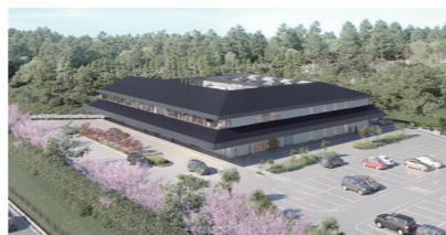
▲新しい斎場のイメージ図

10月から今の斎場を稼働させながら、7年3月まで敷地内に新しい斎場の建設を行い、その後、8年3月まで今の斎場の解体を行います。工事期間中は駐車場の減少、通夜・葬儀のための告別室などの貸出停止など、利用者の方にご不便とご迷惑をおかけしますが、ご理解とご協力をお願いします。