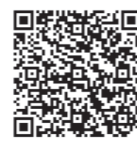
▲ X (旧 Twitter)