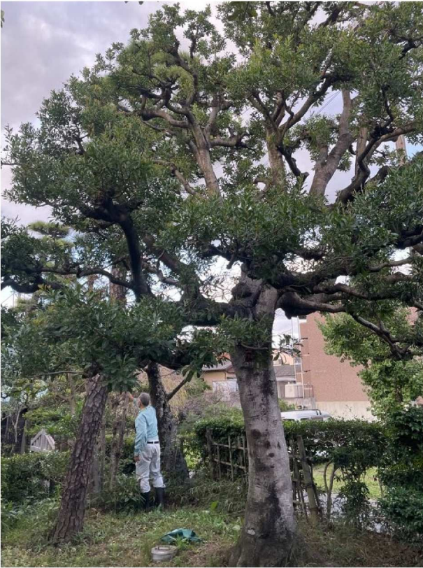
申請樹木5 ヤマモモ (3)