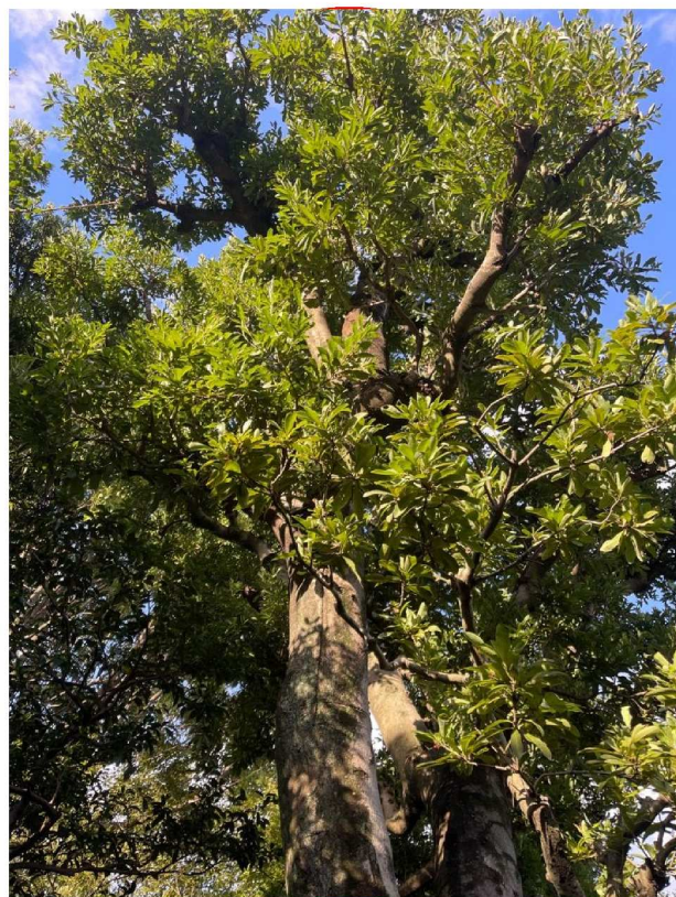
申請樹木3 ヤマモモ (1)