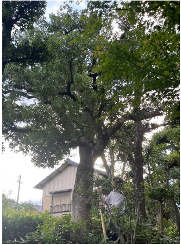
申請樹木6 ヤマモモ (4)