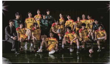
▲大同特殊鋼ハンドボール部フェニックス