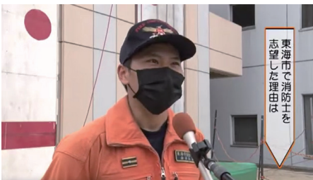
東海市で消防士を 志望した理由は