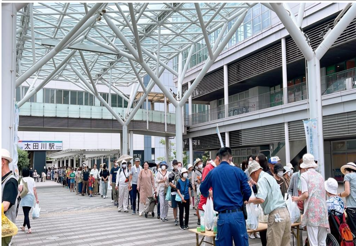
過去の活動状況写真（花苗の無償配布）