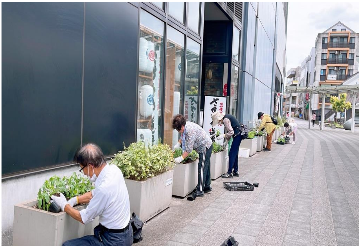
過去の活動状況写真（花の植栽）