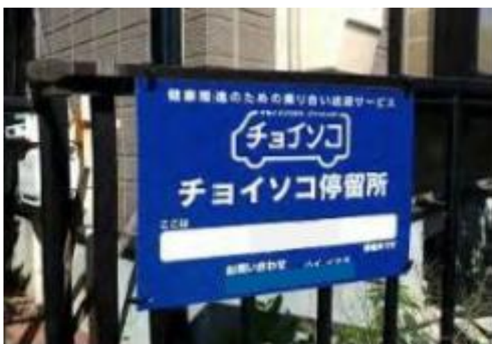
停留所のイメージ写真