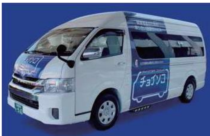
デマンド交通実証実験で使用する車両のイメージ写真