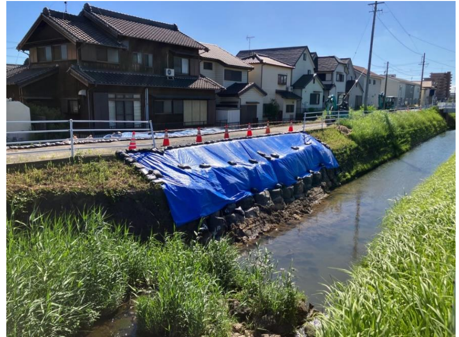
応急復旧完了後の状況