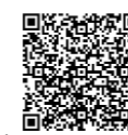
認定こども園入園関係