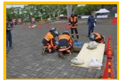
救助訓練 (重量物除去・搬送)