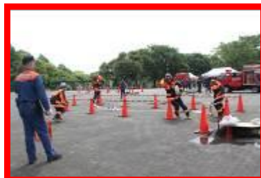
火災訓練 (可搬ポンプ・ホース延長・消火)