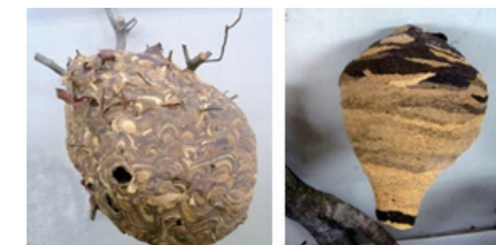
スズメバチの巣 ・マーブル模様 ・球体