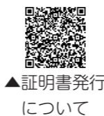
▲証明書発行について