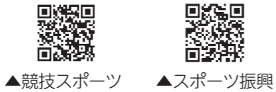
▲競技スポーツ ▲スポーツ振興