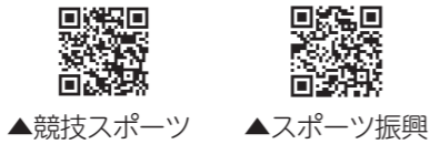
▲競技スポーツ ▲スポーツ振興